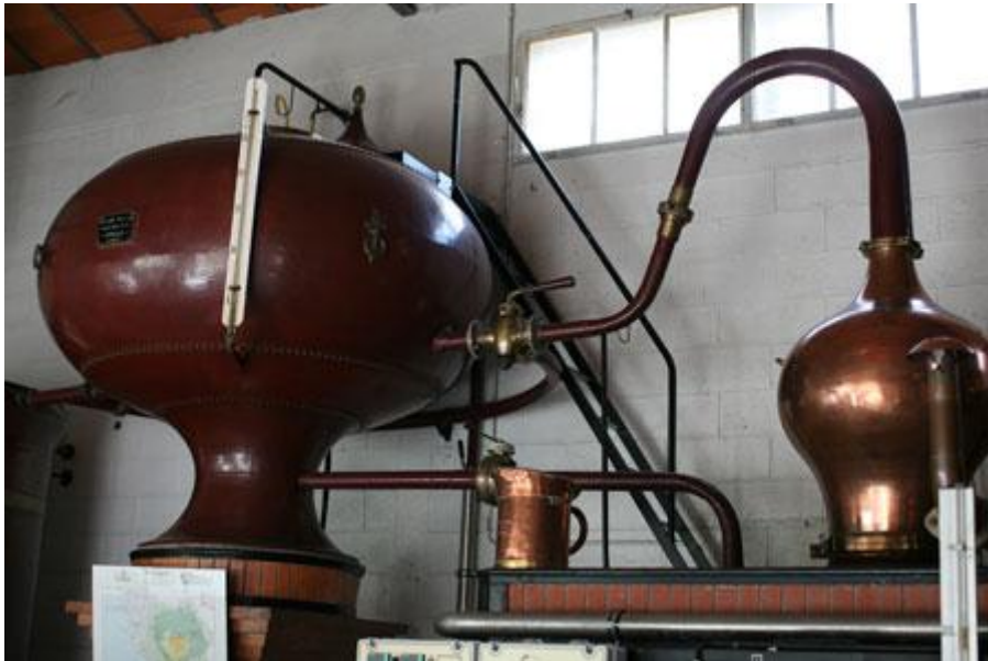
■ 法國乾邑 Braastad House 夏朗德黃銅壺式蒸餾器

乾邑的每個製造過程都被置於「國家乾邑行業管理局( The Bureau National Interprofessionnel du Cognac- BNIC)」管理之下，以保證聲譽日隆的乾邑的品質。