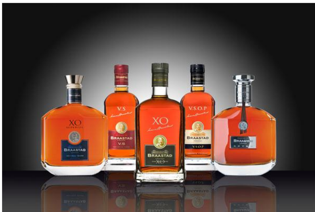
■ 寶伯特乾邑 BRAASTAD COGNAC, TIFFON

不過，如為此不買新酒而花幾倍的價錢去購買被炒高了的舊樽裝的乾邑，又似非上策，舊樽裝的乾邑喝一瓶少一瓶，終有難覓一日。筆者認為，如今市面上有法國著名品牌乾邑白蘭地，原是歐洲的百年知名老牌，新到大中華，還未受同胞瞭解或垂青，才會保持那些年的乾邑水準，不要錯過時機，快去買了，因那些都是調上了真正的生命之水陳年老酒。如今在法國到酒莊去找「一瓶二十年以上的乾邑就上萬，如是Extra rare或二十年以上的“優質香檳區XO”更已是拍賣的天價了」不要猶豫，買了不喝也可珍藏。這將是另類的“拉菲投資”。