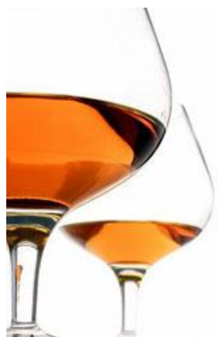
■ 球形矮腳大肚酒杯