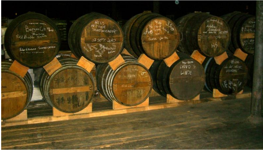
■ 寶伯特酒窖 (Braastad House) 的陳年老木桶