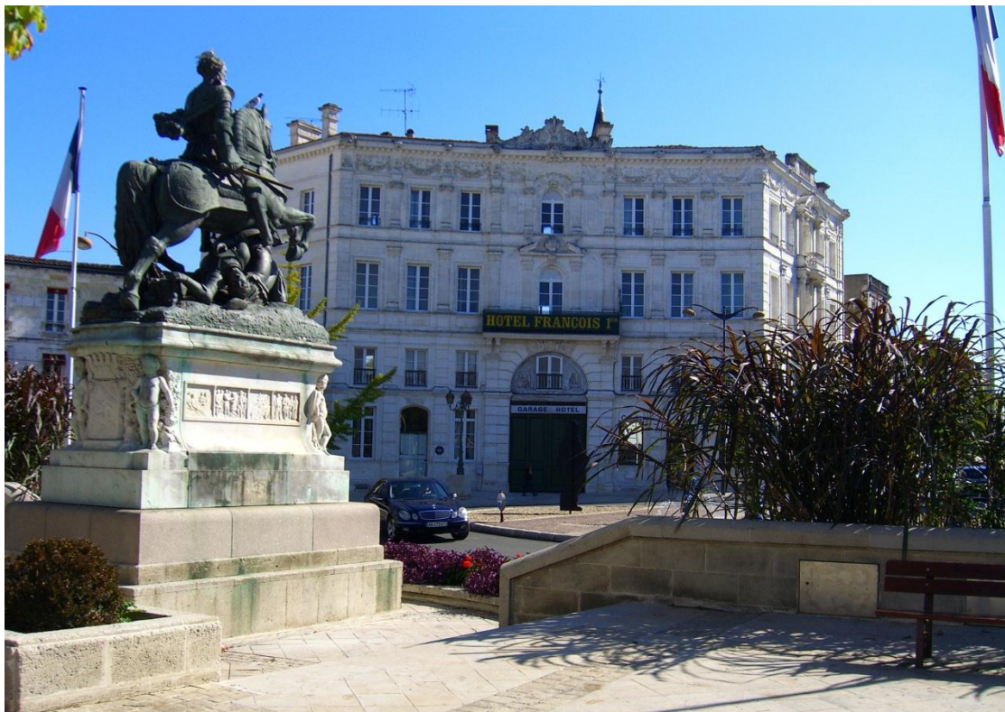
■ 法國夏朗德省(CHARENTE)小鎮乾邑(Cognac)。

“乾邑 (Cognac)”是法國中西部瀕臨大西洋的夏朗德省(CHARENTE)之一小鎮名。法定產區位於大西洋邊阿坤廷盆地(the Aquitaine basin) 的北部，西部以吉倫特河口(Gironde estuary)和 Ré et Oléron 島為界，東面以安格雷姆(Angoulême)為界，毗鄰中央高原(the Massif Central foothills)。地形以平原和低海拔的山丘為主。夏朗德河(Charente river)橫穿整個地區。產區包括整個濱海夏朗德(Charente-Maritime) 省，還包括夏朗德省(Charente)的大部分和多爾多涅省 (Dordogne)和德塞夫勒省 (Deux-Sèvres)的一小部分。這裡溫和的海洋性氣候常年非常穩定，全年平均溫度大約 13°C，冬季也不是太冷。