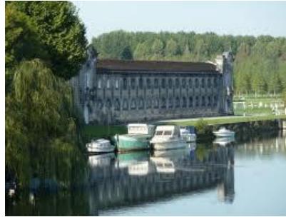
■ 位於夏朗德河(Charente river) 畔的寶伯特乾邑廠 BRAASTAD HOUSE

寶伯特(Braastad) 的生產標準高於乾邑產區生產法令規定的標準，設以寶伯特乾邑 Braastad Cognac 的分級命名為標準，市面上的其它乾邑品牌或級數可沿用如下：