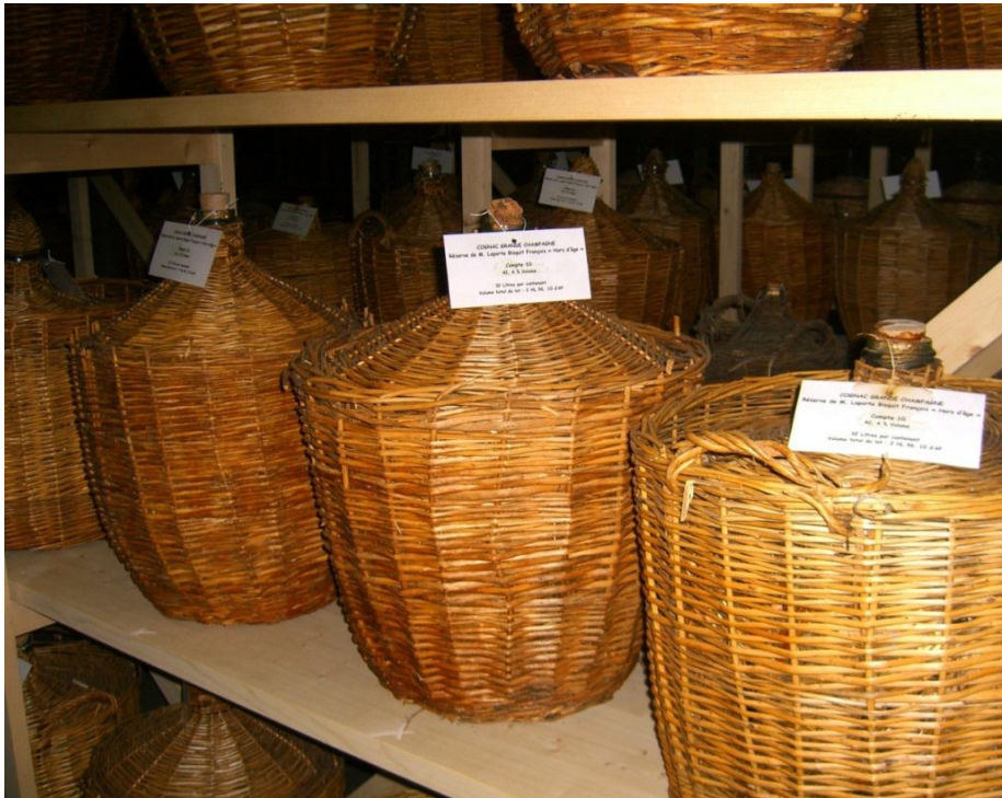
■ 寶伯特酒窖 (Braastad House) 的天堂一角密封玻璃罈子(“Dames-Jeanne”)

在放到老木桶或“天堂一角(A Corner of Paradise)”之前整個陳化過程中，乾邑“生命之水(eau-de-vie)吸取橡木的精華，在與空氣的接觸中，逐漸失去一些酒精，體積會變少。這種自然的蒸發被非常詩意地稱為“天使的分享(The Angel's Share)”。這裡失去的量，於乾邑區相當於每年超過兩千萬瓶酒消失在大自然中，這是酒的生產者毫不猶豫獻予天使的貢品，以換取乾邑的完美品質。這些酒精的蒸汽滋長了一種用顯微鏡才能看見的真菌(microscopic fungus)，或名為“torula