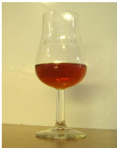
■ 寶伯特鬱金香形酒杯

用球形矮腳大肚酒杯喝白蘭地非常流行，它可以讓白蘭地的香氣更加濃鬱，當然，實際上它並不是最理想的杯型。恰當的杯具是使用鬱金香形酒杯。(註 8)