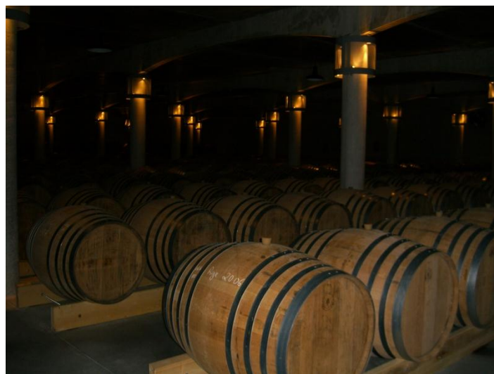
■ 法國乾邑布隆古堡 (Château de Beaulon) 的酒窖 2010 年 10 月 8 日攝

蒸餾過後的白酒，由於帶有原始粗獷的香味，所以必須要經過儲存陳熟 (Ageing) 釀造。而儲存用的容器，一般都使用容量在 270 至 450 公升左右的木桶。陳化過程必須在國家乾邑行業管理局 (BNIC) 認證的酒庫中進行，只有這樣，才能獲得法國乾邑行業管理局頒發的乾邑酒齡和產地證明。國家乾邑行業管理局 (BNIC) 必須定期派人前往酒廠檢查和登記酒齡 (2003 年修正法案)。